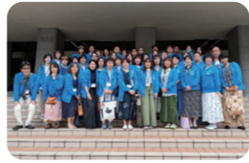
おそろいのパーカーで活動