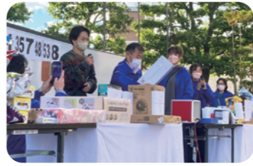
後援会主催のピンゴ大会