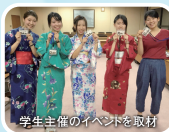
学生主催のイベントを取材