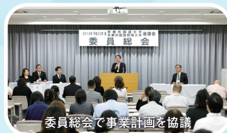
委員総会で事業計画を協議