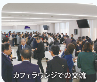
カフェラウンジでの交流