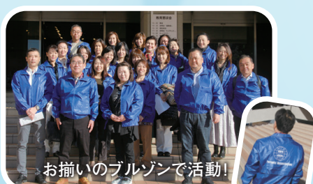
お揃いのブルゾンで活動!