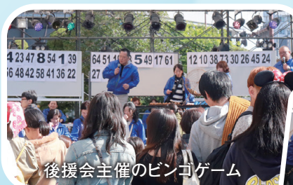
後援会主催のビンゴゲーム