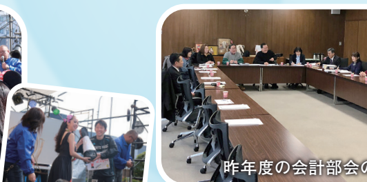
昨年度の会計部会の様子